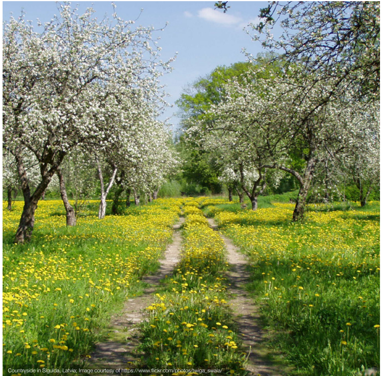
Countryside in Sigulda, Latvia; Image courtesy of https://www.flickr.com/photos/twiga_swala/