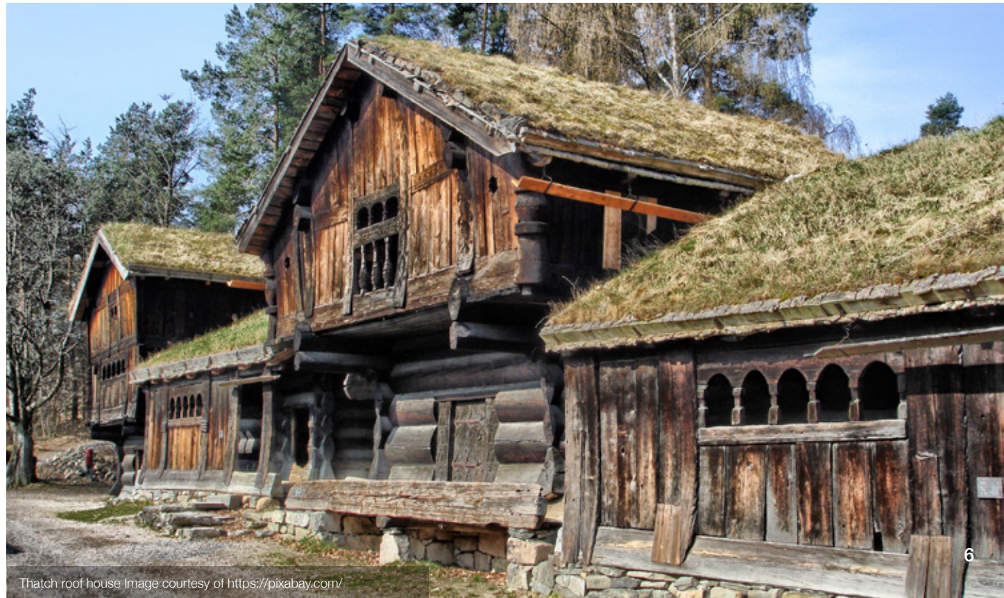
Thatch roof house