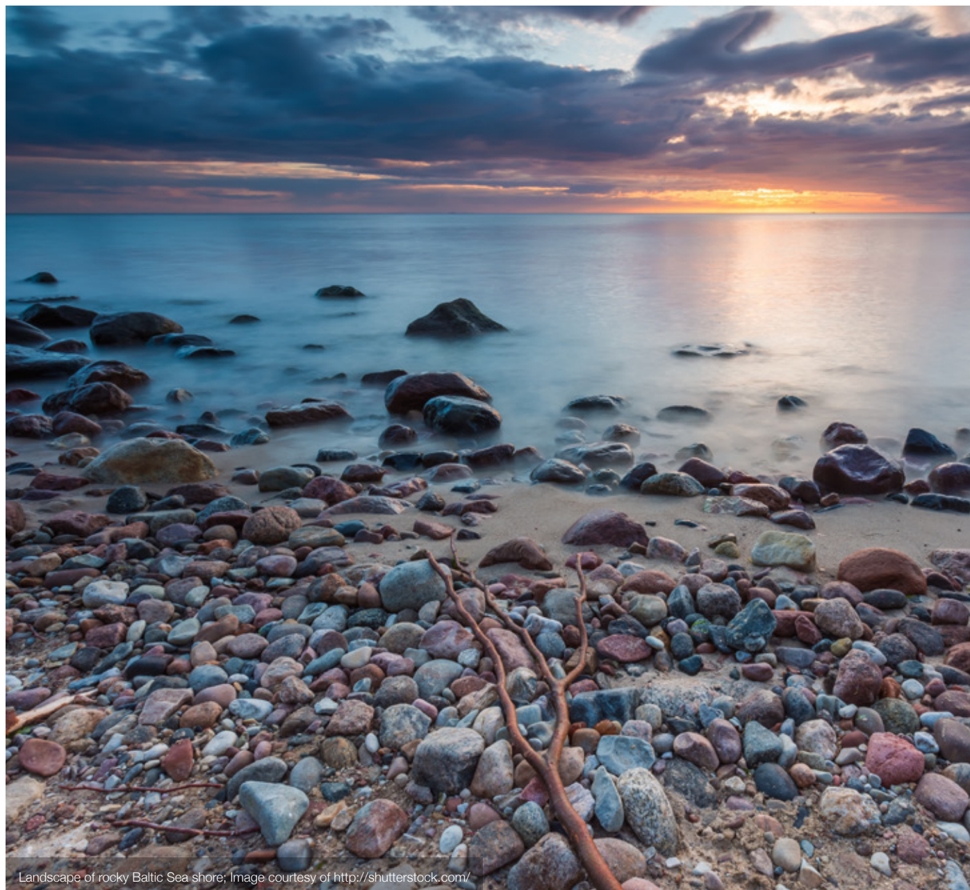
Landscape of rocky Baltic Sea shore; Image courtesy of http://shutterstock.com/

Las cualidades del proyecto enumeradas anteriormente son requisitos mínimos; El resumen de la competencia está abierto a la adaptación ya mejorar las estrategias de desarrollo.