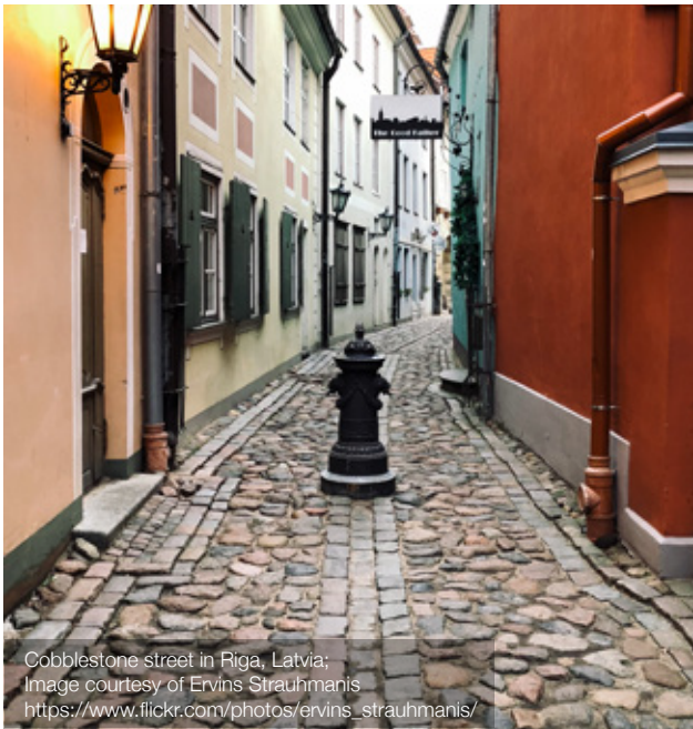
Cobblestone street in Riga, Latvia; Image courtesy of Ervins Strauhmanis https://www.flickr.com/photos/ervins_strauhmanis/

Sin embargo el recurso más grande del país son las regiones apasionantes vírgenes. Letonia ofrece las posibilidades sin fin tanto para los habitantes locales como para los visitantes para disfrutar de la belleza natural prístina de este país poco habitable, garantizando un ambiente ideal para las caminatas, el ciclismo y la contemplación de la naturaleza en las condiciones naturales más variadas, incluso las playas con arena blanca y las dunas cubiertas de pinos.