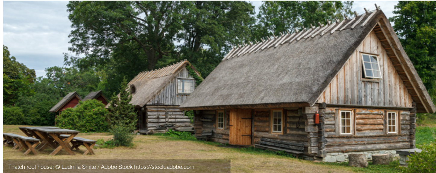
Thatch roof house

Cuando Letonia en el siglo XIII fue conquistada por los caballeros alemanes, los estilos de arquitectura alemanes comenzaron a sustituir la arquitectura popular letona de las ciudades y poblados. Por eso los edificios más grandes y las obras más decorativas, tales como las iglesias por lo habitual no han sido construidas en estilo popular, aunque en algunas aldeas existen tales edificios.