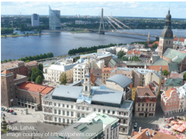
Riga, Latvia

Letonia se encuentra en Europa del Norte, en el litoral del Este del Mar Báltico y en la parte del noroeste del Cratón europeo oriental. Su historia cultural mixta y variada lleva encima el rastro de intervenciones de cada Estado regional grande. Aquí el clima es continental moderado húmedo, y en las regiones litorales el clima es expresado más marítimo, con el verano más fresco y con los inviernos más suaves.