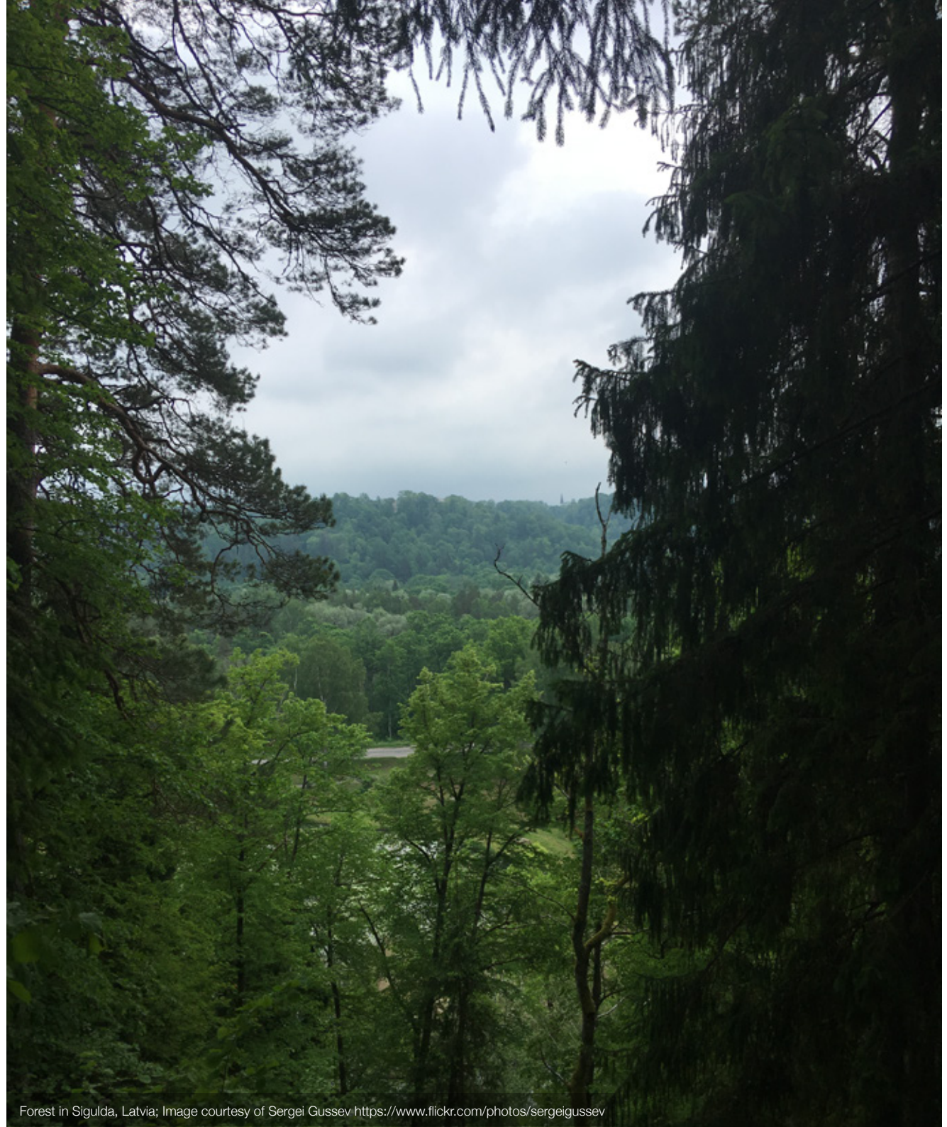
Forest in Sigulda, Latvia; Image courtesy of Sergei Gushev https://www.flickr.com/photos/sergeigushev/